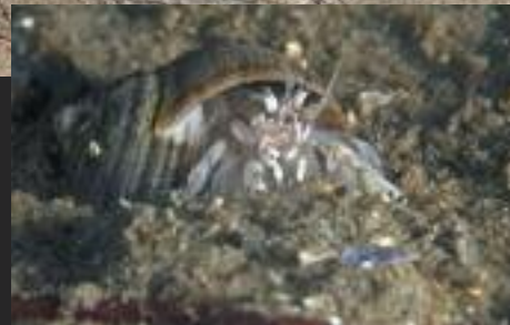
Diogenes pugilator, kleine heremietkreeft

In de tropen, tijdens nachtduiken, zijn er krabben, maar ook slakken met huisjes, die uit het zand komen kruipen, zodra het donker wordt. Er zijn ook enorme slakken zonder huis, de pleurobranchi (meer kieuwigen), ze kunnen wel 30 cm worden. Hoe ze dan ademen onder het zand is een raadsel. Misschien hebben ze niet veel lucht nodig, wanneer ze overdag gewoon stil zitten.