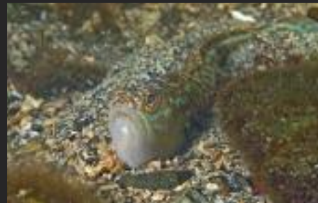
Grote pieterman, Noorwegen