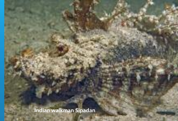
Indian walkman Sipadan