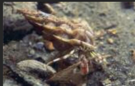
Wenteltrap met hermietkreeft, Oosterschelde